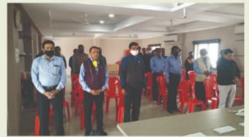
Respect to the Motherland in the New Year Celebration. Everybody sing the State Anthem (Vande Utkala Janani)