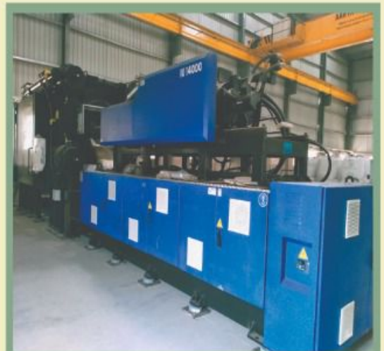
New Machine installed at Somanathpur Plant. This is one of the largest machines in the Eastern Region of India