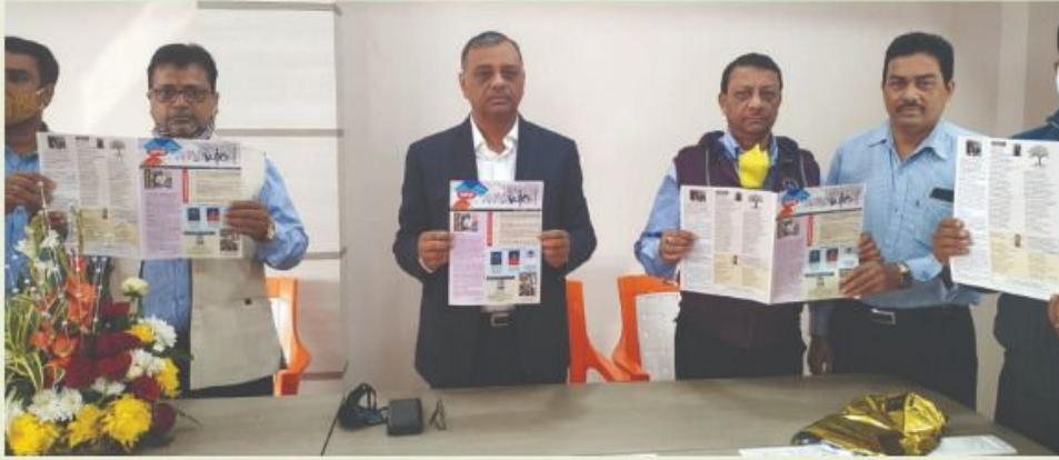
Release of Ankur Voice by MD along with the Senior Members