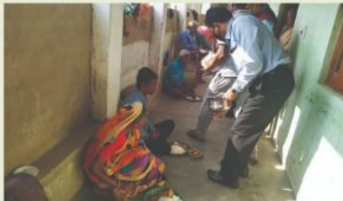
DISTRIBUTION FOOD AT AMRIT DHARA OLD AGE HOME