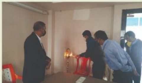
The auspicious activity started with Lightening the Lamp