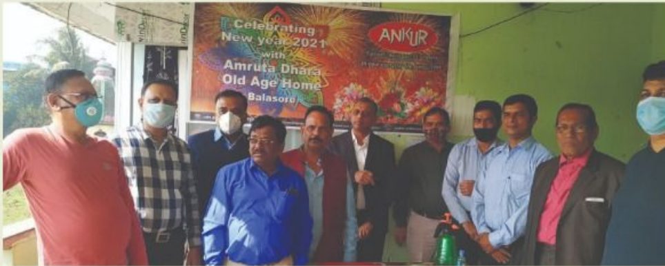
Spending some time with the inmates of Amrit Dhara (Old Age Home)

Time is very precious and we must understand the importance of time. Any time lost is lost for ever. My request to all of you is to make productive use of time. Every day, try to learn some new thing. Learning will enhance your level of confidence, improve your skill and will help doing things in a better manner.