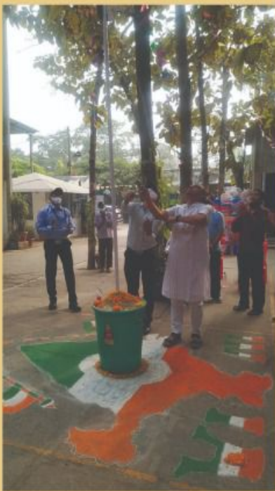
CELEBRATION OF REPUBLIC DAY