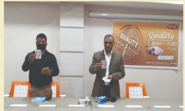
Quality Policy and Training hand book was released by MD and other Senior Members